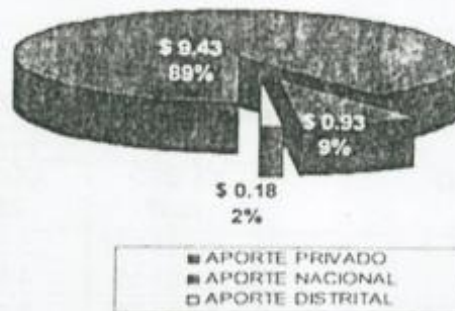
APORTE SEGURIDAD 2008 (Billones de pesos)